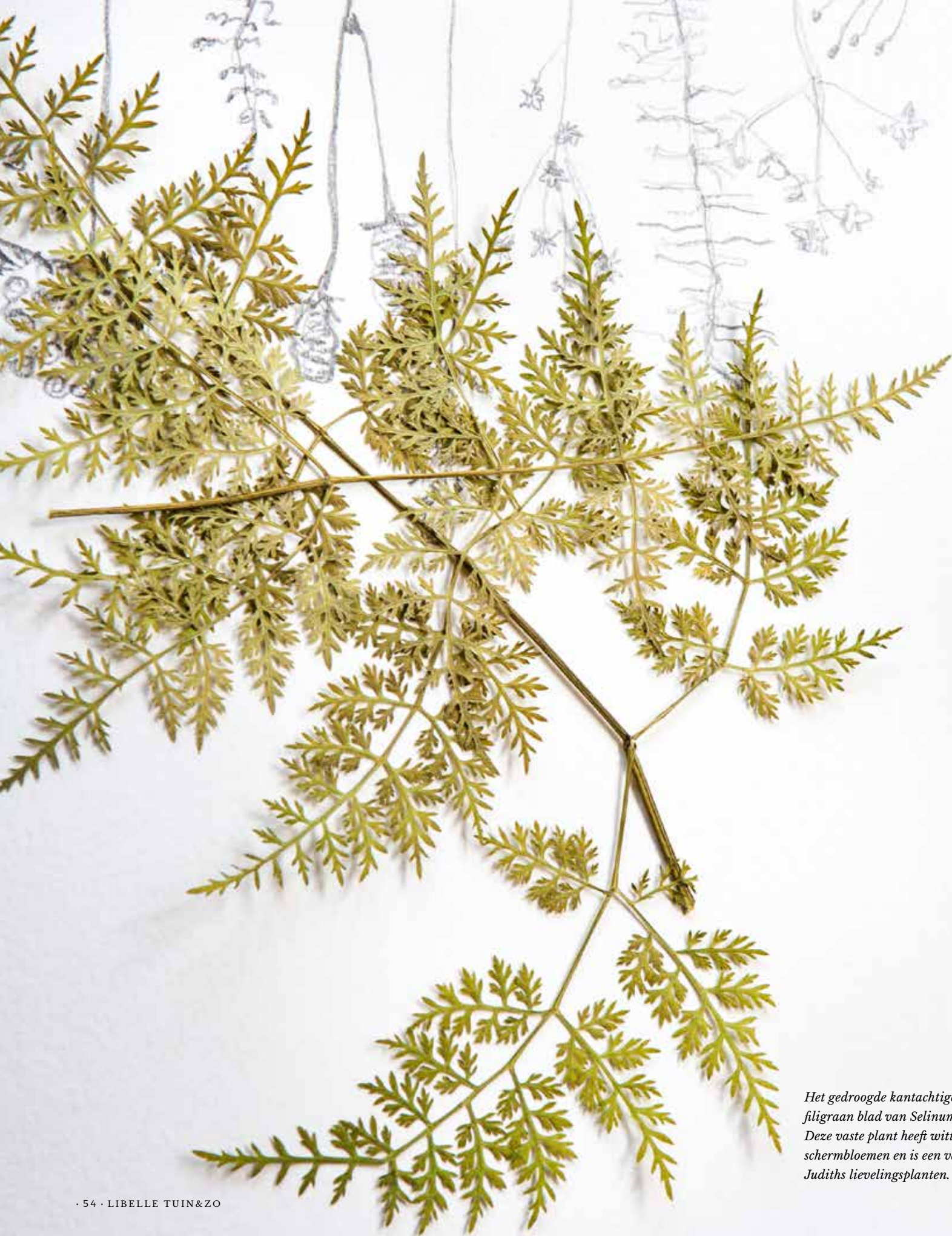
Het gedroogde kantachtige, filigraan blad van Selinum. Deze vaste plant heeft witte schermbloemen en is een van Judiths lievelingsplanten.