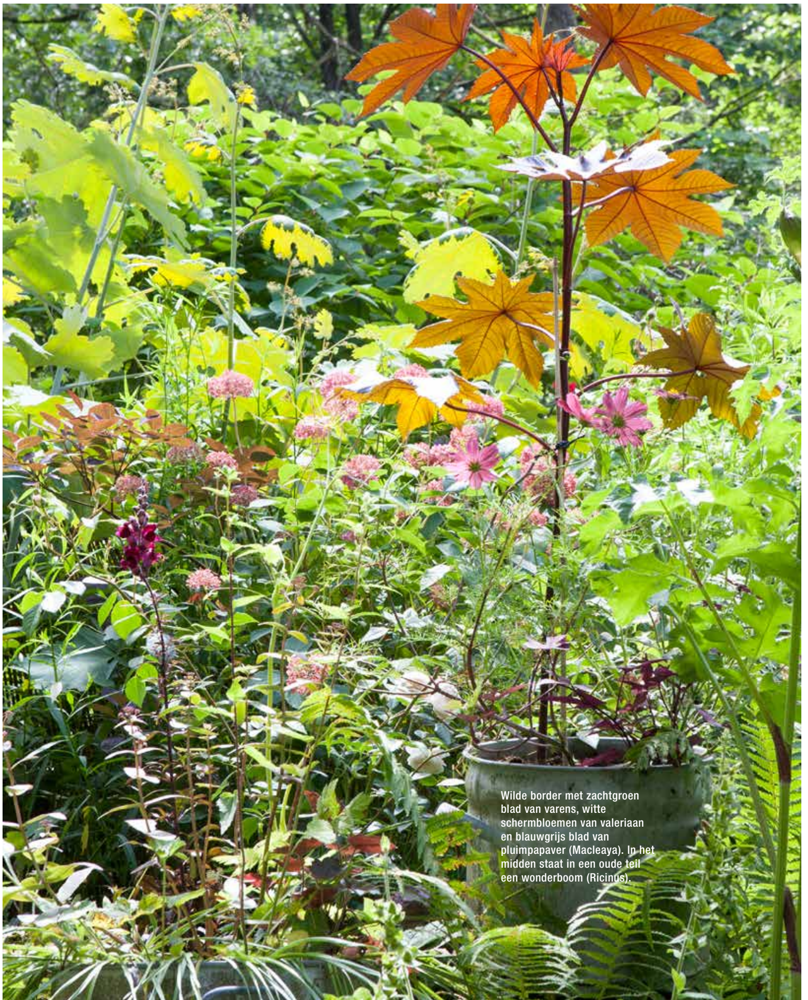
Wilde border met zachtgroen blad van varens, witte schermbloemen van valeriaan en blauwgrijs blad van pluimpapaver (Macleaya). In het midden staat in een oude teil een wonderboom (Ricinus).